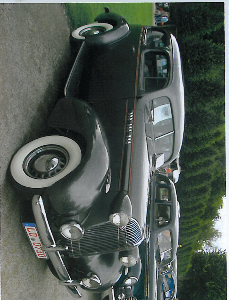
Schwetzingen : grande nouveauté cette année : une aire dédiée aux Américaines. Voici une rare Oldsmobile L36 de 1936.