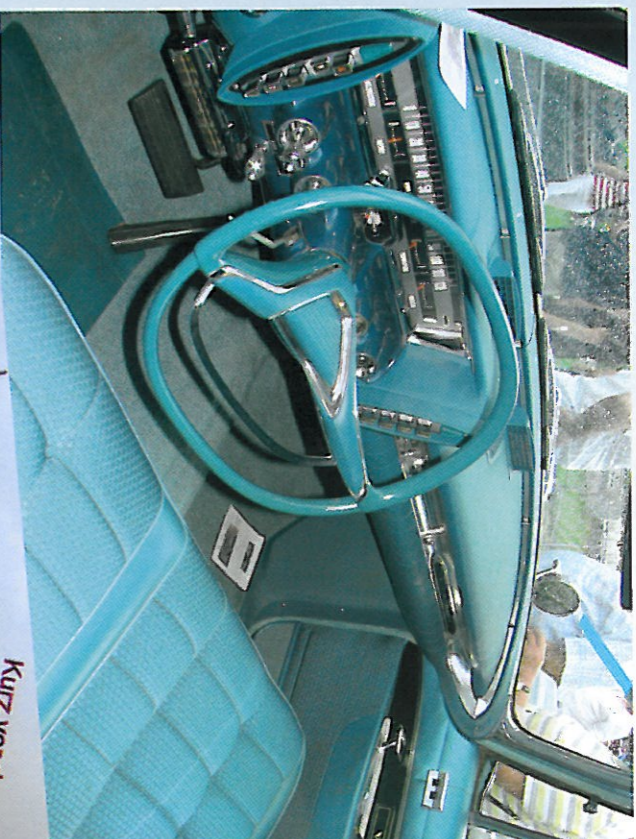
Baden-Baden : intérieur d'une Chrysler Imperial Le Baron de 1961 : l'une des voitures les plus luxueuses jamais construites. Son premier propriétaire : le ministre des affaires étrangères du Liban.

Dans le parc du château de Schwetzingen, c'est la cerise sur le gâteau : un déferlement de raretés, la quasi-totalité en état concours. Cette fois, nous allons dans le détail, ce que nos amis collectionneurs allemands apprécient. Rigueur, sérieux et précision. Des questions bien ciblées qui font mouche et font